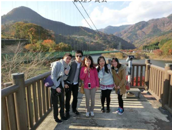
本州一の長さの歩道吊り橋もみじ大吊り橋