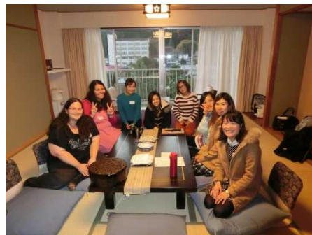
鬼怒川観光ホテル