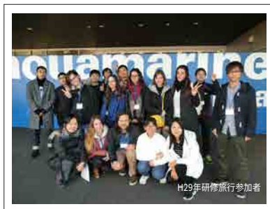
H29年研修旅行参加者

ホームステイ体験を通して、 新しい浜通りの姿を体感してください！ みなさんの参加を お待ちしております♪