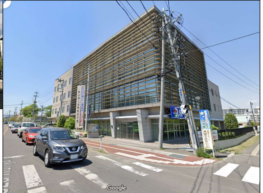
仙台出入国在留管理局 郡山出張所