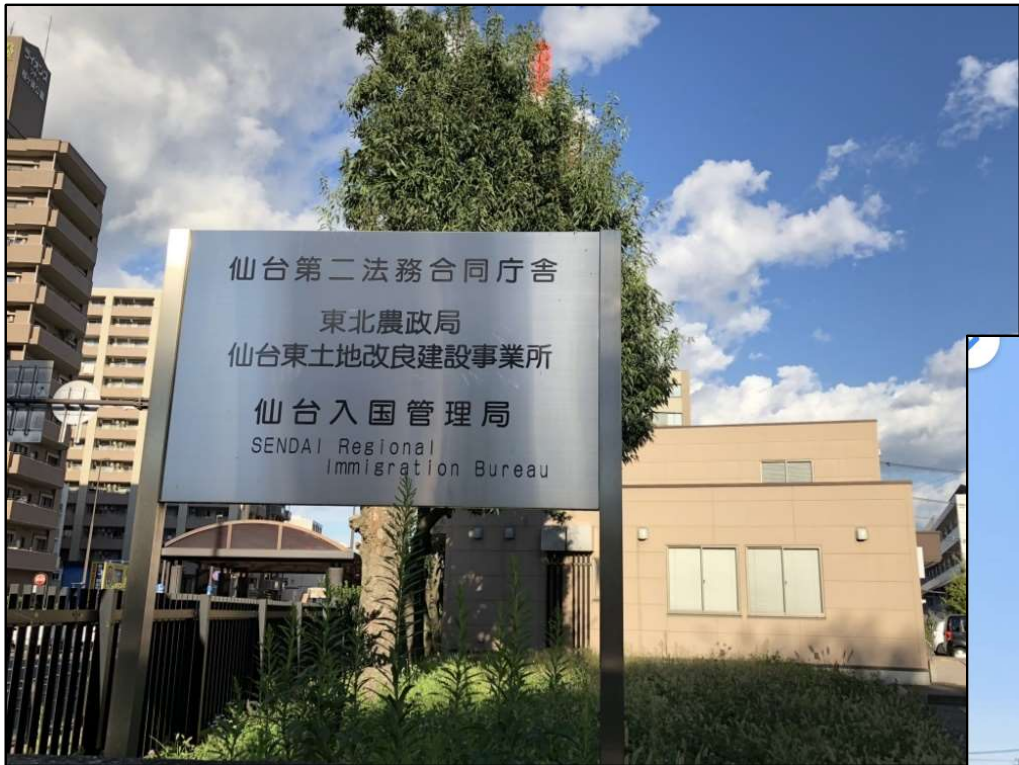
仙台出入国在留管理局